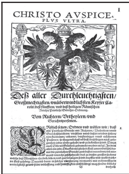
La Constitutio Criminalis Carolina de 1532 según una impresión de 1577 41 .

La base para evaluar la calidad jurídica de los procesos de brujería que tuvieron lugar, entre 1678 y 1680, en el condado imperial de Hohenems-Vaduz, fue la Constitutio Criminalis Carolina de 1532, es decir, la ley penal y procesal del Sacro Imperio Romano Germánico. Aunque esta ley criminalizó la hechicería, no se trató de un mero texto oscuro, sino también de la ley penal más moderna de la Europa de esta época con un alto grado de sistematización, un buen nivel dogmático y una multitud de garantías para la seguridad de los involucrados. Un buen ejemplo de la modernidad relativa de la Constitutio Criminalis Carolina , puede reconocerse en el delito de adulterio, donde se rompió con