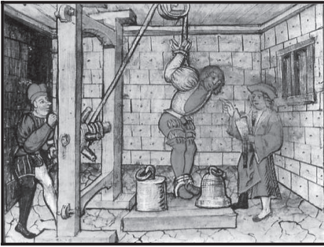
La tortura en el proceso penal 46 .

el proceso inquisitorio del Antiguo Régimen no aceptó ninguna condena en la mera base de indicios, sino requirió la confesión del delincuente como la reina de las pruebas, pues la verdad debía ser evidente para todos 47 . Por supuesto, esto fue nada menos que la cuadratura del círculo: la simbiosis estrecha entre una especie de estatalidad de derecho y su antítesis, la tortura.