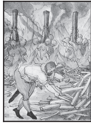
La demonología de la modernidad temprana: de los bailes eróticos de las brujas con el diablo hasta la incineración pública de las delincuentes 20 .