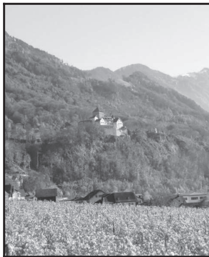
El castillo de Vaduz en Liechtenstein fue la sede de gobierno del condado de Hohenems-Vaduz 12 .